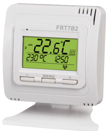
termostat – nadajnik