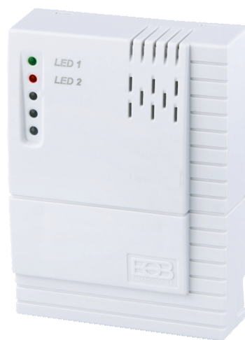
jednostka włączająca – odbiornik